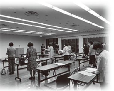
令和4年4月21日 令和4年度総会