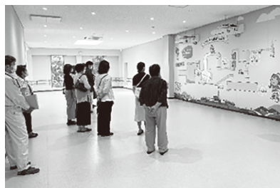
令和4年9月12日 宮津与謝クリーンセンター見学

宮津商工会議所女性会では、今後も自己研鑽のための講演会・研修会、会員交流事業など様々な事業を実施してまいりたいと思っておりますので、一緒に活動いただける会員を募集しています。是非一度お問い合わせください。