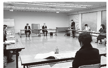
令和4年10月24日 宮津市長との懇談会