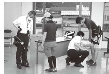
体験・説明会の様子