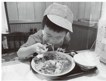
フォト部門受賞作品