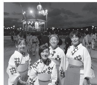
8月 宮津燈籠流し花火大会 市民総おどりに参加