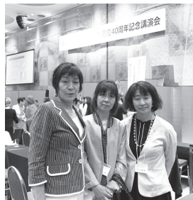
5月 京都商工会議所女性会 創立40周年記念事業に出席