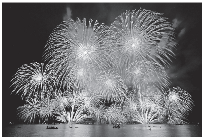
フィナーレ「100年市民花火」

宮津市制70周年記念事業・宮津線100周年記念事業として実施した「宮津燈籠流し花火大会」は、多くの事業所・市民の方々をはじめ関係団体の方々から、多大なるご支援・ご協力をいただき、大過なく無事終了することができました。