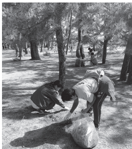
4月 天橋立の清掃活動に参加

宮津商工会議所女性会では、新入会員を募集しています。自己研鑽をはじめとする様々な事業を実施しておりますので、あなたも会員になって参加されませんか?《問い合わせ》 宮津商工会議所 ☎22-5131