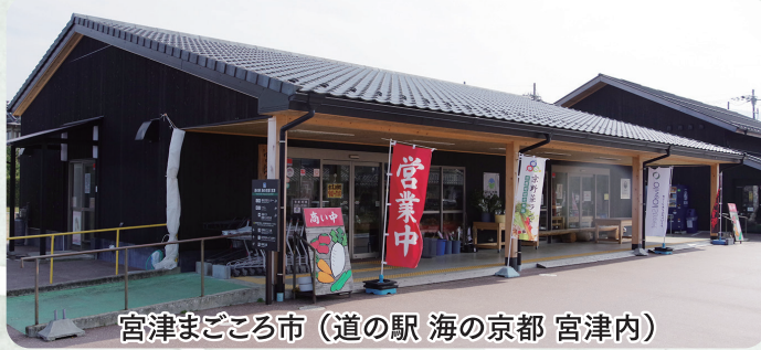
宮津まごころ市（道の駅 海の京都 宮津内）