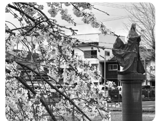
「宮津の幽斎桜」 (於 大手川ふれあい広場)