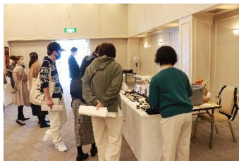
過去の開催の様子 ※今回とは会場が異なります。