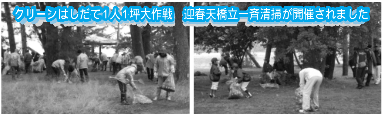
クリーンはしだて1人1坪大作戦

詳しくは京都労働局労働基準部賃金室 ☎075-241-3215 又は最寄りの労働基準監督署にお尋ね下さい。