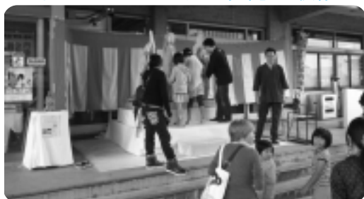
【H26.7.13 「Lカードフェスティバル」】