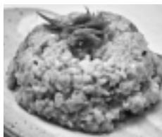
初代チャンピオン へしこチャーハン

去る11月1日、宮津市浜町において「海の京都」エリアの16店舗のご当地グルメが集結し、「いっちゃん旨いモン」の称号をかけて競い合う、『海の京都グルメ合戦 ～宮津浜町の乱～ feat.宮津満腹祭』が開催されました。