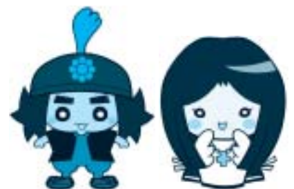
たあくん ガラシャちゃん 宮津市「愛されキャラ」