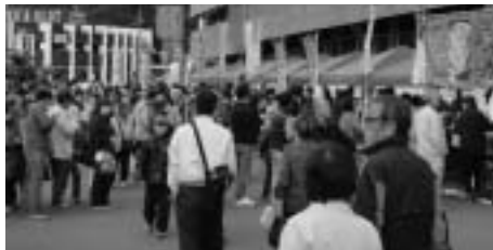
<昨年のイベントの様様>